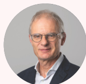
Berchtold von Steiger