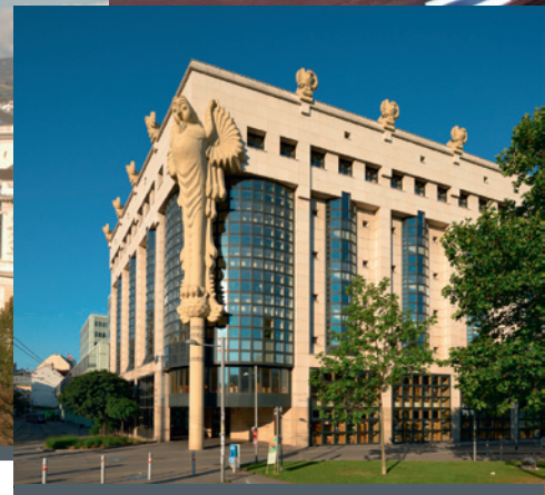
TU Wien (Bibliothek)

Der erste Zyklus von Quality Audits nach österreichischem Qualitätssicherungsgesetz ist praktisch abgeschlossen: von den insgesamt 21 österreichischen Universitäten haben 19 ein erstes Quality Audit durchgeführt, zwei befinden sich noch in der Zertifizierungsphase. Die AAQ hat in den Jahren 2014 bis 2018 Quality Audits an den Universitäten Innsbruck, Linz und Wien, der Technischen Universität Wien, der Montanuniversität Leoben sowie der Universität für Musik und Darstellende Kunst Graz durchgeführt.