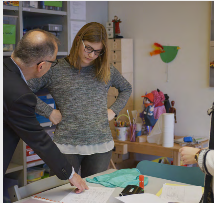
Portraitfilm HfH 2018