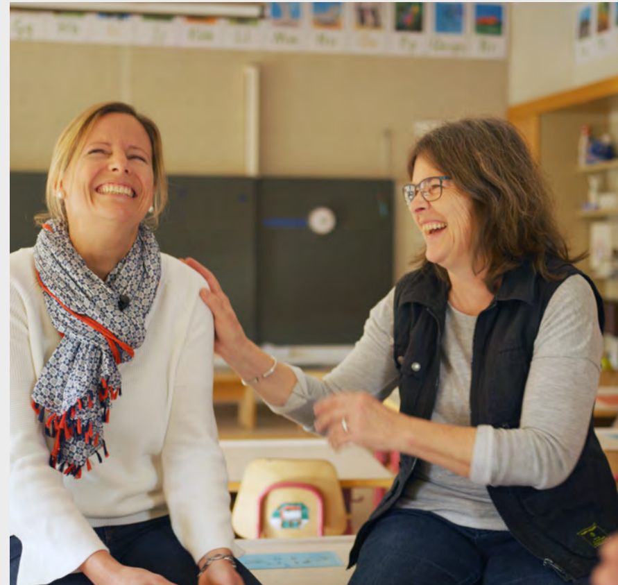
Portraitfilm HfH 2018