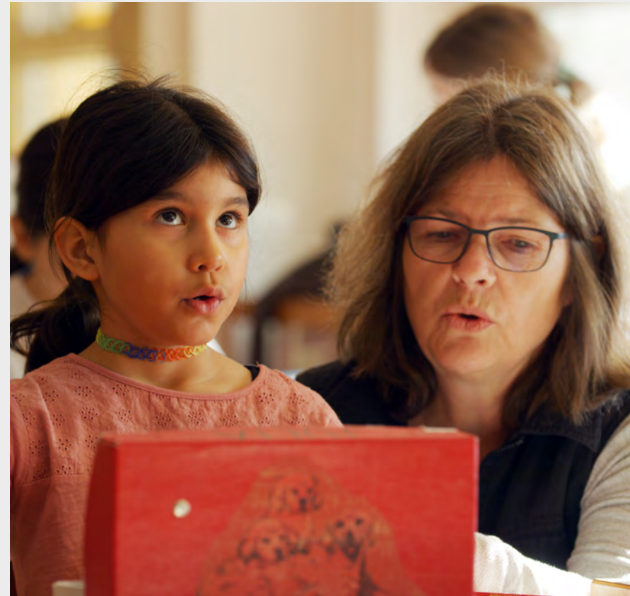
Portraitfilm HfH 2018