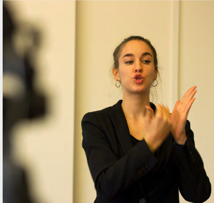
Portraitfilm HfH 2018