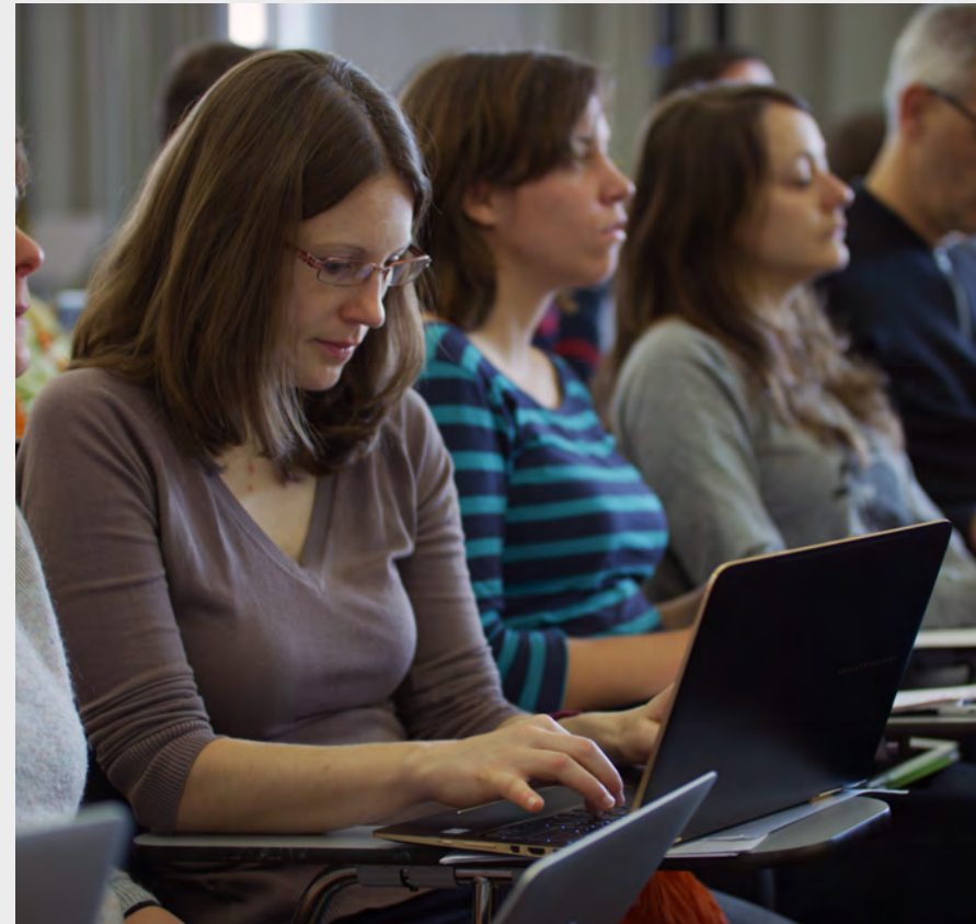
Portraitfilm HfH 2018