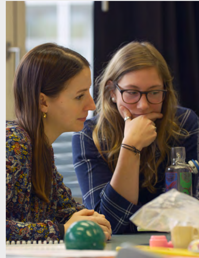
Portraitfilm HfH 2018