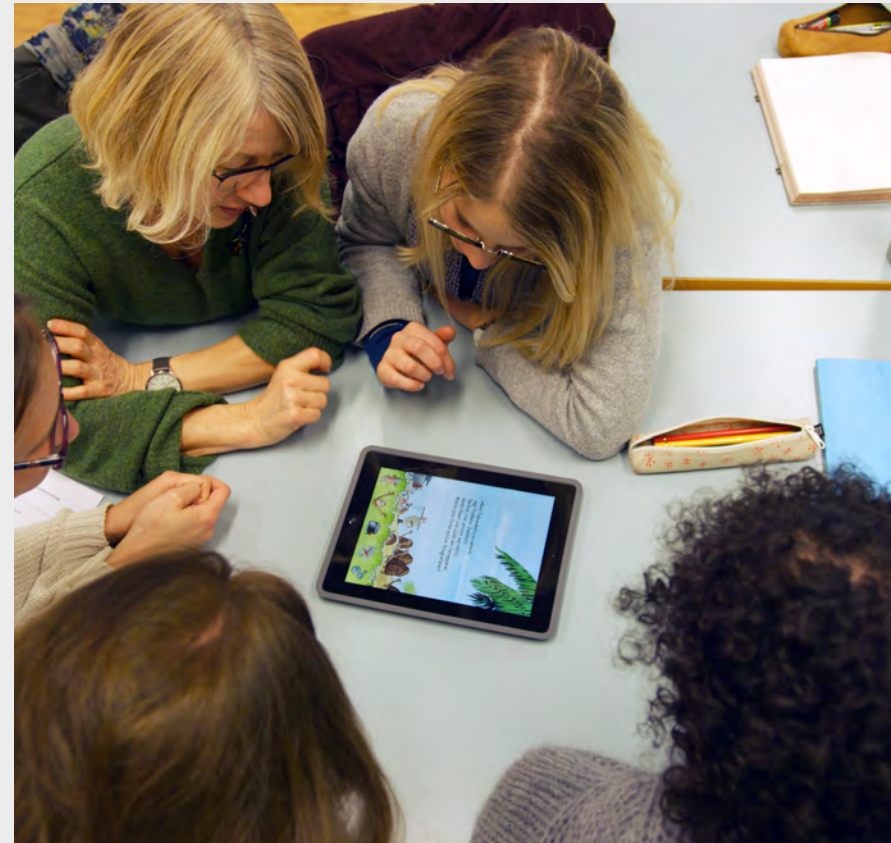
Portraitfilm HfH 2018